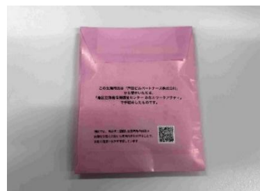
ご寄付いただいた生理用品の活用例 (戸田ビルパートナーズ株式会社の社名が刻まれています)